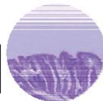
PALBIO PDP nélkül alulfejlett bél